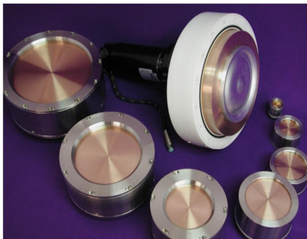
Circular Cathode 圆形平面阴极